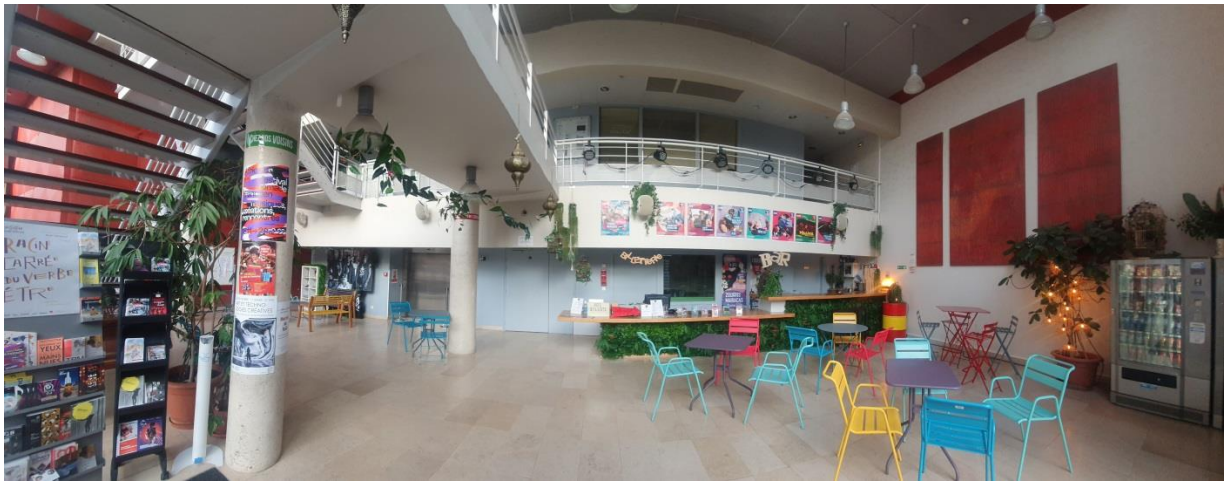
Le hall de l'Odéon