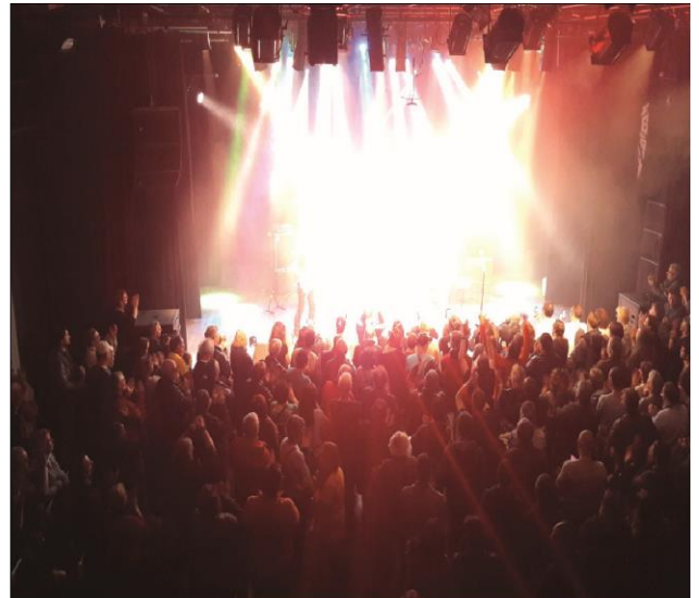
Configuration debout 400 places