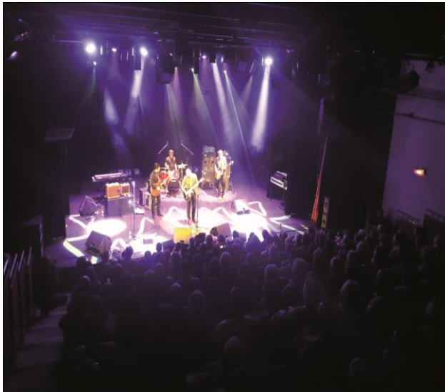
Configuration assise 178 places